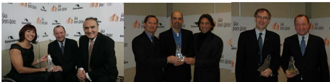
La photo officielle des récipiendaires du Gala Sports-Québec

8. Lors des courses de sanction régionale où les départs regroupés sont en vigueur, le sous-classement n'est pas admis.