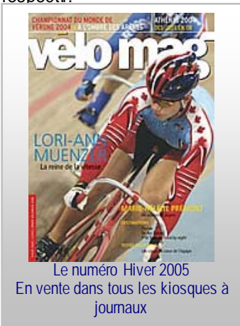
Le numéro Hiver 2005 En vente dans tous les kiosques à journaux

Cette année, Vélo Mag présentera aussi six grands portraits d'athlètes québécois de même que leurs destinations préférées. Et, en prime, il y aura six guides thématiques insérés dans l'une ou l'autre des éditions du Vélo Mag : le Guide des activités cyclistes au Québec, le Guide officiel de Vélirium (Mont Sainte-Anne), la nutrition sportive, l'entraînement, des destinations américaines et des escapades québécoises.