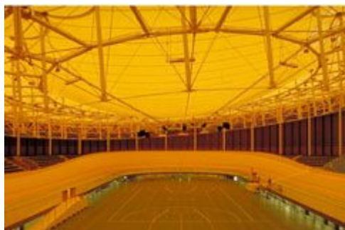
Le vélodrome du CMC à Aigle