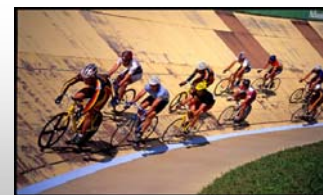
Ça va rouler à Bromont les 29-30 juillet prochain !

http://www.fqsc.net/06/Comp/piste/Info-course/P-info-ChampQc-Piste06.pdf