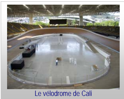
Le vélodrome de Cali