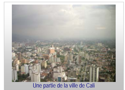
Une partie de la ville de Cali

D'autres athlètes se sont également illustrés. Jean Quevillon a obtenu une récolte de trois médailles individuelles, dont une d'argent au CLM individuel, et deux de bronze en poursuite individuelle et au 1000m sur piste. Malheureusement, une chute lors de la course sur route l'a contraint à l'abandon. À souligner également les deux