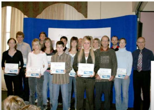
Gagnants du classement Sports Experts 2008

Merci également à tous les parrains qui se sont associés à cette activité en supportant une ou plusieurs catégories.