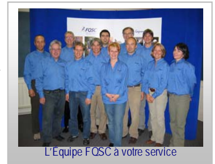
L'Équipe FQSC à votre service

Les échanges se sont avérés très positifs dans l'ensemble et permettront assurément de jeter des bases solides pour la prochaine année. Merci une fois de plus à tous les participants !