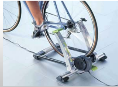
Tacx i-magic

Rélié à votre ordinateur, votre Tacx i-magic gère votre environnement d'entraînement avec une intelligence inouïe, ce qui n'empêche pas un 'pas-à-ite-sur-les-pitons' comme moi de l'installer convenablement en un rien de temps. Il vous permet de générer vos propres parcours d'entraînement ou des parcours mythiques – Alpe d'Huez, Tourmalet et autres Galibier – ou de fixer vos fréquences ou intensités cibles d'entraînement sans vous donner de maux de tête. Et les plus machos d'entre nous peuvent communiquer leurs performances par le Net aux autres membres de la 'secte' Tacx. Mais attention, pour vous assurer d'avoir une mesure fidèle et précise de votre puissance de pédalage, je vous recommande de prendre le temps de bien étalonner votre appareil, ce qui se fait sans encombre grâce à la géniale fonction de votre bidule, prévue à cet effet. Personnellement, ce que j'utilise le plus, c'est le mode qui me permet de pédaler à puissance pré-fixée, quelle que soit ma cadence de pédalage : la résistance imposée s'ajuste automatiquement. Elle augmente si j'adopte une cadence basse; inversement, elle diminue si je me mets à moudre à haute cadence. Ainsi, pas moyen de tricher; si vous fixez la puissance à x watts, vous devrez rouler à x watts, quoi qu'il advienne! Le prix de ce bijou ? Moins de 2 000 $ CDN.