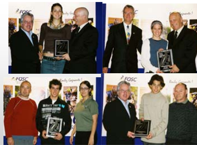
Quelques récipiendaires