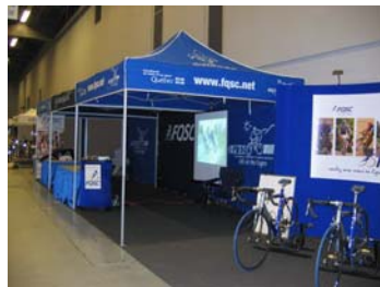
Le kiosque de la FQSC

Soulignons par ailleurs la présence fort remarquée à ce